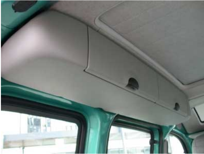
Über den Sitzplätzen befinden sich Verstaumöglichkeiten, wie man sie auch aus Großraumflugzeugen kennt.