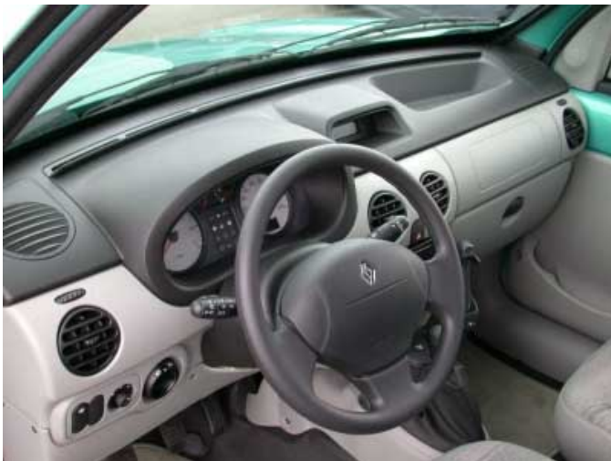
Außer den Bedienelementen für Heizung und Lüftung sind die Schalter und Instrumente funktionell und übersichtlich positioniert.