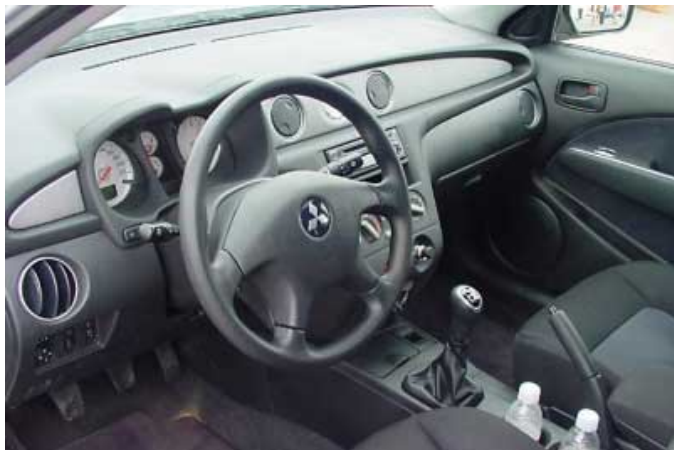
Einfache Bedienung und funktionelle Armaturenbrettgestaltung kennzeichnen den Fahrerplatz des Outlander.