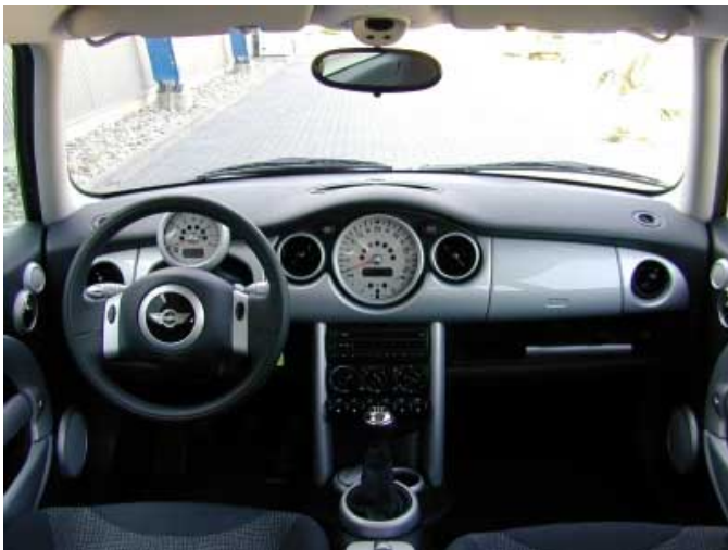
Das Armaturenbrett besticht durch viel Liebe zum Detail. Leider geht die Funktionalität dabei etwas verloren.