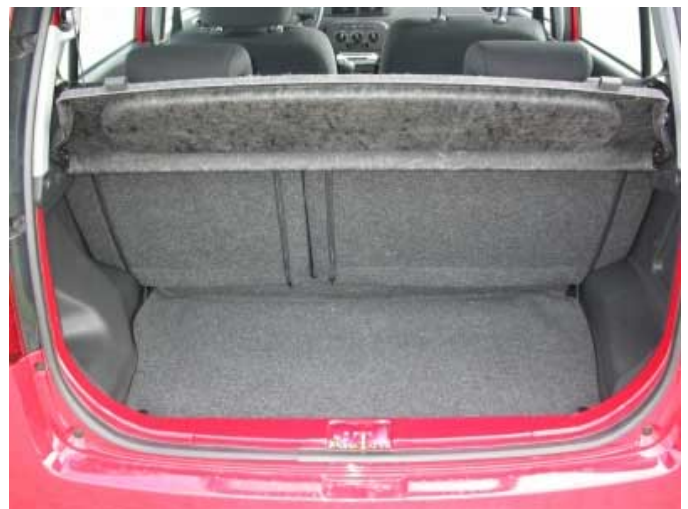
Nur 135 l Volumen bietet der Kofferraum des Cuore.