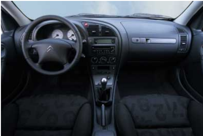
Während die Instrumente keinen Grund für Tadel bieten, lassen verschiedene Bedienelemente Raum für Verbesserungen.