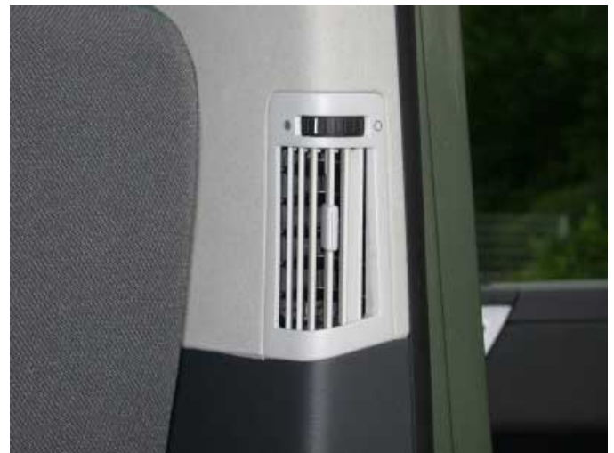
Für die hinteren Sitzplätze gibt es separate Lüftungsdüsen. Leider verdient die Heizung kaum ihren Namen, denn die Wirkung ist äußerst bescheiden.