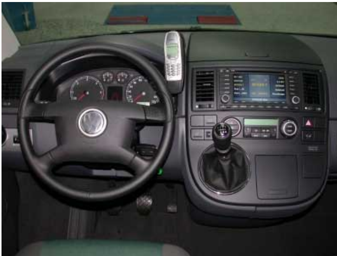
Entgegen dem Trend setzt Volkswagen weiterhin nicht auf extravagantes Design sondern auf nüchterne Funktionalität.