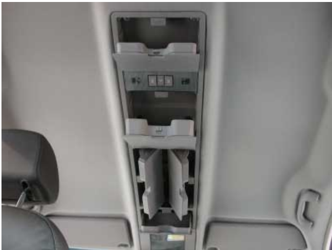
So etwas kennt man aus dem Flugzeug: Staufächer an der Decke.