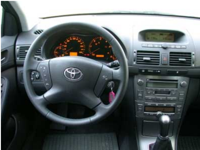
Die Bedienbarkeit ist fast schon vorbildlich, die verwendeten Materialien und die Verarbeitung erreichen Premium-Niveau.