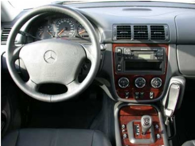
Am Fahrerplatz gibt es nur wenig zu bemängeln.