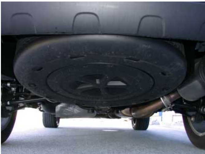
Das Reserverad ist außen unter dem Kofferraumboden befestigt. Das spart zwar Platz im Innenraum, es ist aber schwer erreichbar.

den Stoßfängern untergebracht. Die Bodenfreiheit für Fahren im schweren Gelände ist zu gering. Der Innenraum lässt sich nur sehr aufwendig reinigen.