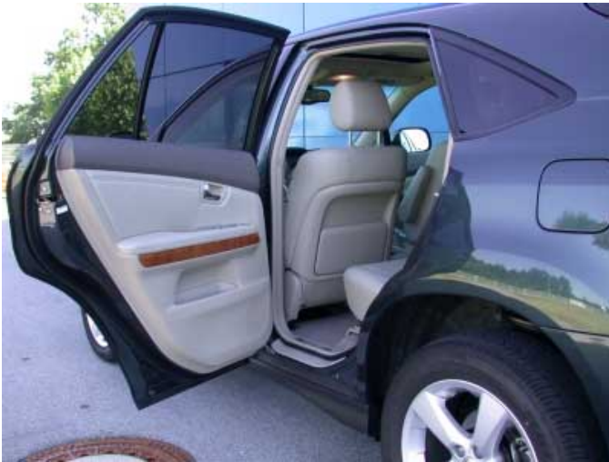
Auch wenn der Lexus recht hochbeinig daherkommt, sind doch die hinteren Sitzplätze relativ bequem erreichbar.

ist wegen der großen Kofferraumtiefe schlecht zugänglich.