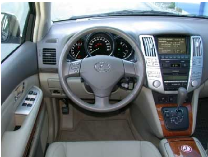
Modernes Design und komfortable Bedienung kennzeichnen den Lexus. Leider lässt sich auf dem Bildschirm bei Sonneneinstrahlung kaum etwas erkennen.

nungswächter, der dafür sorgt, dass sich die Batterie bei abgestelltem Motor nicht entladen kann.