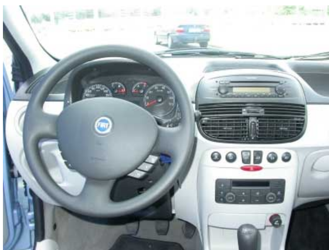
Leider lässt sich am Fahrerplatz eine ganze Liste von Mängeln zusammenstellen. Daß es besser geht, zeigt die Konkurrenz.