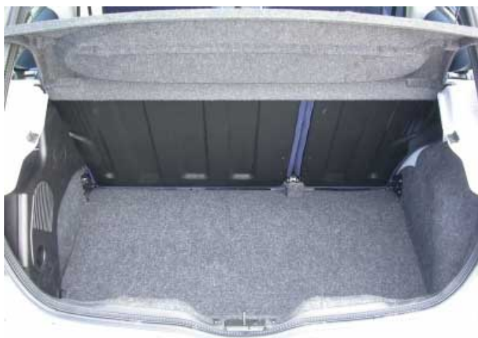
Mit 265 l Volumen ist der Kofferraum von klassenüblicher Größe.

dreitürigen Version umständlich, weil der Zugang nach hinten schlecht ist. Um vorgeklappt werden zu können, müssen die Kopfstützen abgezogen und verstaut werden. Beim Zurückklappen ist es recht mühsam, die Gurtschlösser wieder in Position zu bringen. Für kleine Utensilien fehlen Ablagen.