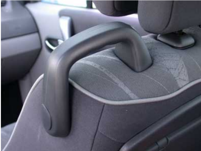
Die vorderen Sitze haben auf der Innenseite Haltegriffe.