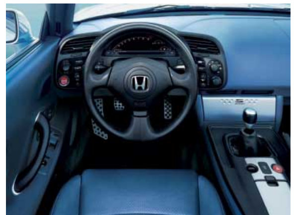
Gute Ergonomie und das Beschränken auf das Wesentliche vereinfachen die Bedienung.

bar und funktionell - man ist schnell mit dem Fahrzeug vertraut. Die digitalen Instrumente sind gut ablesbar und liegen im direkten Blickfeld des Fahrers. Die Bedienelemente der Heizung/Lüftung befinden sich gut erreichbar in der Mittelkonsole, auch das Radio ist günstig platziert. Die Außenspiegel und Türfenster haben praktische Schalter zum Einstellen bzw. Bedienen. - Die Sitzhebel sind sehr schlecht zu erreichen. Insgesamt ist das Angebot an Ablagen zu gering. Die Fenster funktionieren nur mit Zündung.