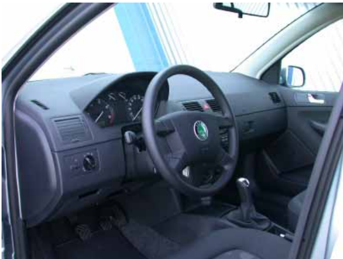
In Form und Funktion des Fahrerplatzes zeigt sich sofort die Verwandtschaft zu den Konzernbrüdern von VW oder Seat.