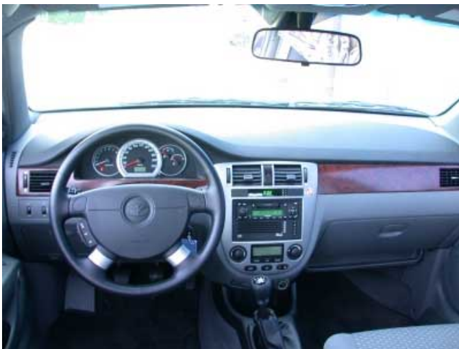
Auch im Innenraumdesign ist ein deutlicher Fortschritt zu erkennen.