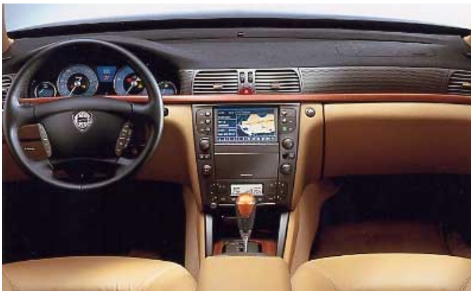
Für die italienischen Momente im Leben: Der Innenraum verwöhnt mit hochwertigen Materialien und liebevollem Design.