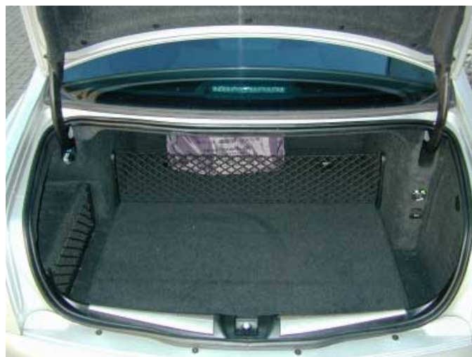
Mit 375l Volumen bietet der Thesis weit weniger Platz als die Klassenkonkurrenten.