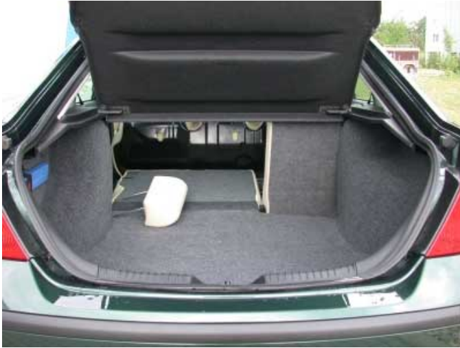
Mit 455 l Volumen ist der Kofferraum des Mondeo einer der größten seiner Klasse.