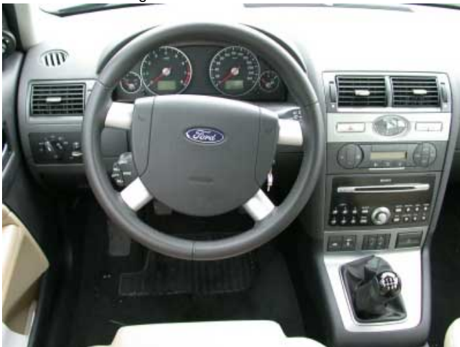
Grundsätzlich ist der Mondeo einfach zu bedienen, im Detail gibt es jedoch Verbesserungsbedarf.