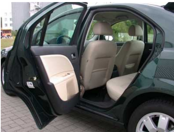
Auch die hinteren Sitzplätze sind bequem zu erreichen.