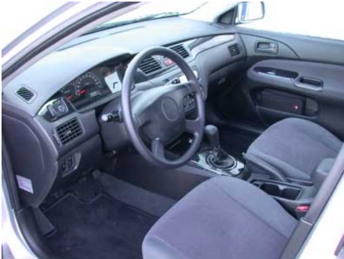
Bedienung und Materialanmutung wecken nostalgische Gefühle an die achtziger Jahre. Daß es sich beim Lancer um eine Neukonstruktion handeln soll, mag man kaum glauben.