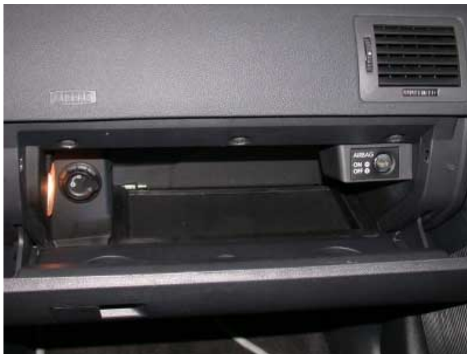
Die Beifahrerairbags lassen sich im kühlbaren Handschuhfach per Zündschlüssel deaktivieren. Damit können auch auf diesem Sitzplatz rückwärtsgerichtete Kinderrückhaltesysteme verwendet werden.