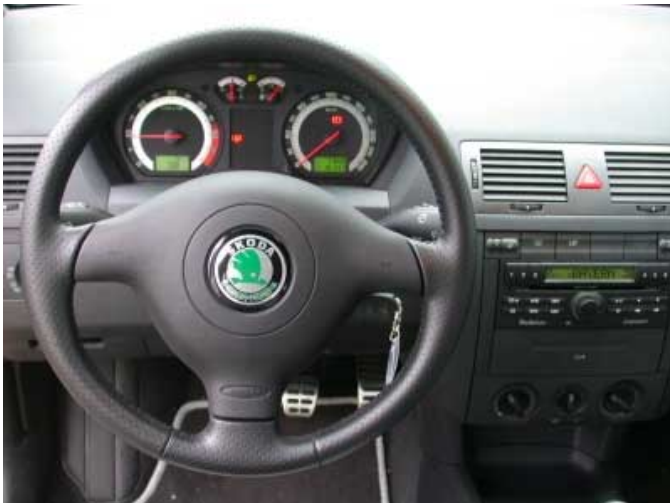
Im Fabia RS verströmen farbig abgesetzte Instrumente und gelochte Alupedale einen Hauch von Sportlichkeit. Der Funktionalität tut dies nur wenig Abbruch.