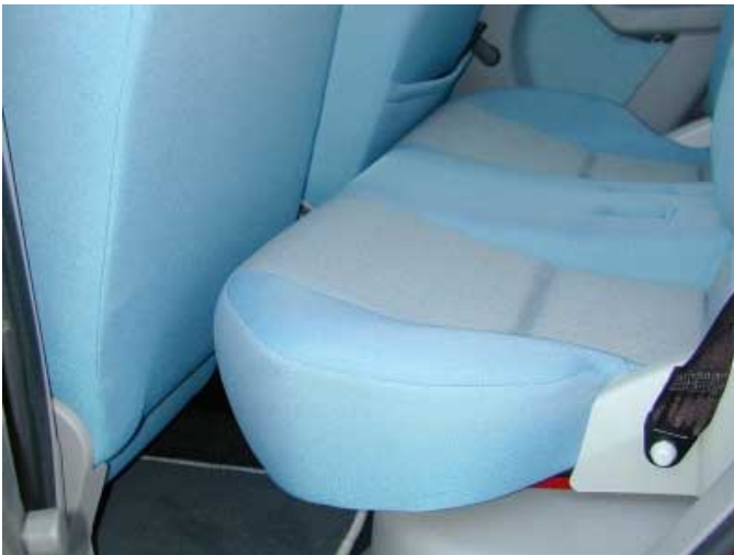
Um das Kofferraumvolumen zu vergrößern, lässt sich die gesamte Rücksitzbank nach vorne schieben. Dann bleibt jedoch kein Knieraum für die hinten Sitzenden erhalten.