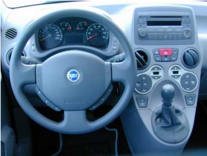
Übersichtlich und weitgehend funktionell präsentiert sich der Fahrerplatz des neuen Panda.