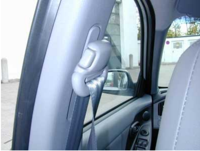
Harte, vorstehende Gurtbeschläge erhöhen das Verletzungsrisiko bei einem Seitencrash. Daß es besser geht, zeigt die Konkurrenz.