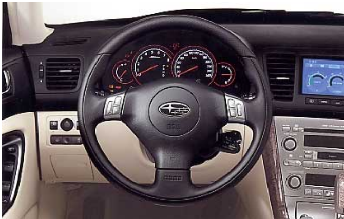
Gute Funktionalität gepaart mit verbesserter Verarbeitungsqualität kennzeichnen den neuen Legacy.