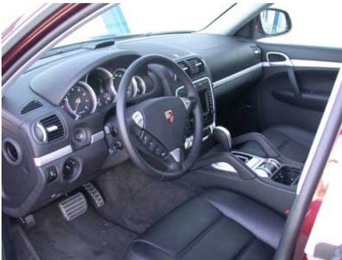
Mit Porsche kommt Sportwagenflair ins Geländewagensegment.