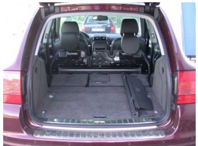
Ein familientauglicher Porsche mit Platz fürs Urlaubsgepäck.

Das Kofferraumvolumen ist durchschnittlich. Normal stehen 435 l zur Verfügung, bei umgeklappter Rückbank steigt die Kapazität auf 810 l (gemessen bis zur Fensterunterkante).