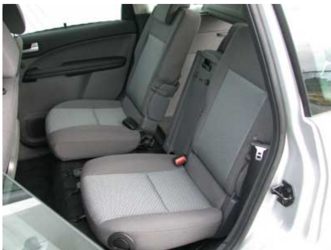
Das Raumangebot auf den Rücksitzen ist nicht besonders üppig. Verzichtet man auf den mittleren Platz und etwas Kofferraumvolumen, sitzt man auf den äußeren Plätzen bequem.