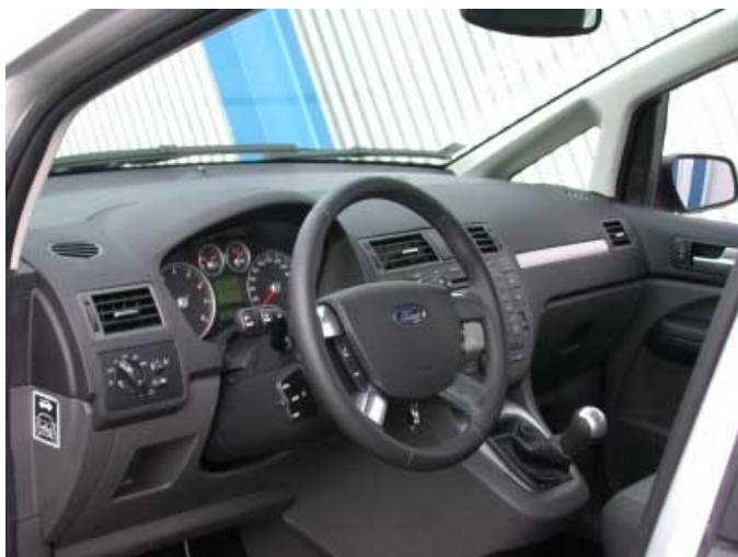
Der Innenraum bietet gewohntes Ford-Ambiente. Die Instrumente sind gut ablesbar, die Bedienung ist einfach und funktionell.