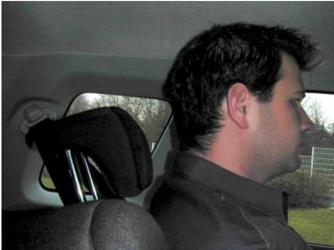
Die Kopfstützen der hinteren Sitzbank schützen nur bis zu einer Körpergröße von 1,45 m und sind damit nur für Kinder geeignet.