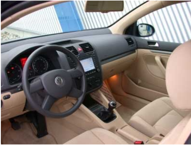
Praktisch, funktionell und hochwertig zeigt sich der Innenraum des neuen Golf.