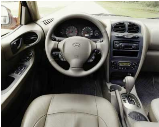
Modernes, funktionelles Design prägt den Santa Fe.