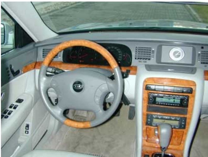
Wenig Kritik lässt der Fahrerplatz des Opirus aufkommen.