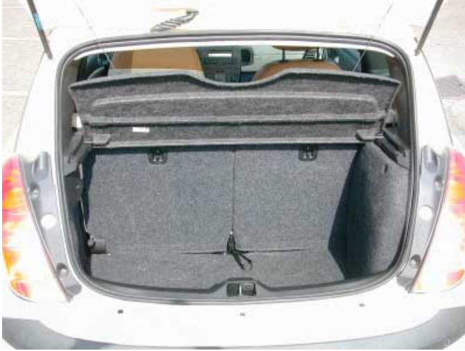
Zwischen 215 und 290 l Volumen bietet der Kofferraum des Ypsilon.