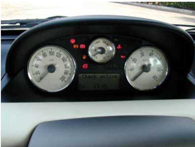
Die Instrumente sind gut ablesbar und in der Mitte des Armaturenbretts platziert.

unter sind u.a. wichtige Funktionen wie Nebelscheinwerfer, Nebelrückleuchte und Scheinwerfer-Leuchtweitenregelung schlecht erreichbar und verwechselbar.