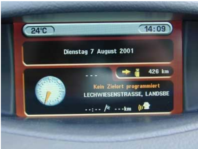
Das große und gut ablesbare Display informiert über viele Betriebszustände des Fahrzeugs.