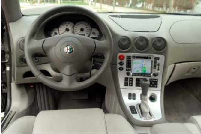
Der Fahrerplatz des überarbeiteten Alfa 166 präsentiert sich sportlich-elegant. Das in die Mittelkonsole integrierte Display ist unübersichtlich tief angeordnet.