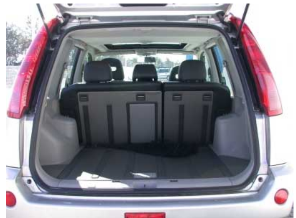
Mit 390 l Volumen ist der Kofferraum des X-Trail groß.