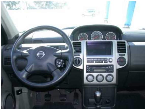
Dem allgemeinen Trend folgend sind die Instrumente in der Mitte des Armaturenbretts positioniert.