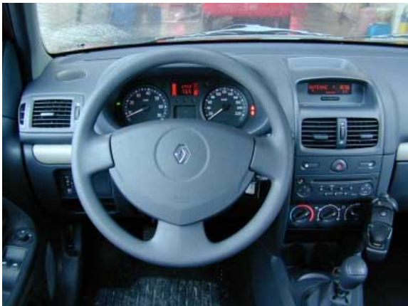
Neben den zu tief positionierten Reglern der Heizung und Lüftung gibt es beim Clio am Fahrerplatz nur wenig zu bemängeln.