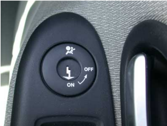
Die Beifahrerairbags lassen sich per Zündschlüssel deaktivieren. Damit können auch auf diesem Sitzplatz rückwärtsgerichtete Kinderrückhaltesysteme verwendet werden.

7,2 l Super pro 100 km. Der Durchschnittsverbrauch liegt bei 6,3 l/100 km.