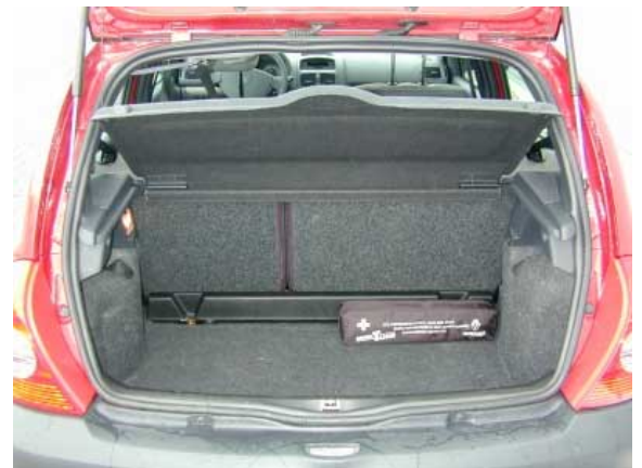
Mit 260 l Volumen ist der Kofferraum des Clio von klassenüblicher Größe und übertrifft sogar geringfügig die Konkurrenz eines VW Polo oder Opel Corsa.