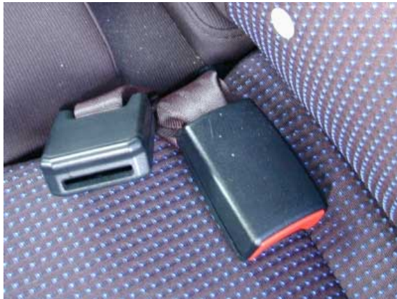
Lose Gurtschlösser auf der Rücksitzbank machen die feste Montage von Kindersitzen nicht gerade einfacher.