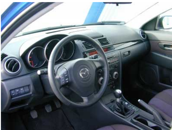
Modernes, sportliches Design dominiert im neuen Mazda 3. Leider ist die Bedienung nicht immer funktionell.