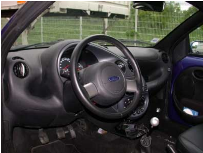
Das Armaturenbrett zeigt keine Unterschiede zu der geschlossenen Version des Ka.