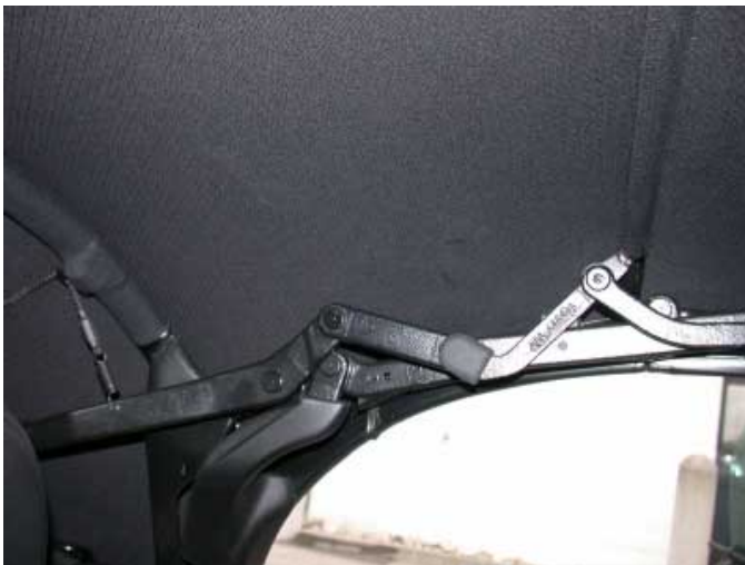
Der unverkleidete Verdeckmechanismus sorgt für ein hohes Verletzungsrisiko bei einem seitlichen Aufprall.