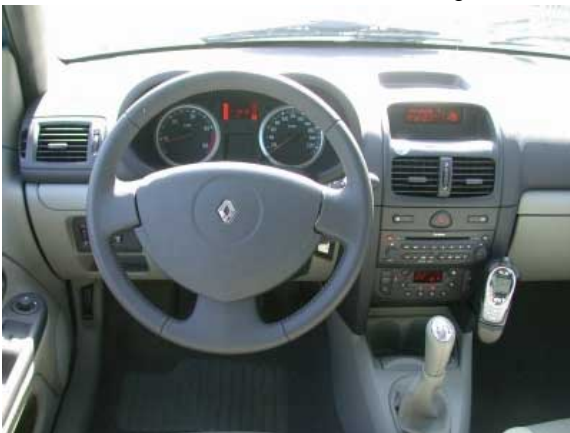
Neben den zu tief positionierten Reglern der Heizung und Lüftung gibt es beim Clio am Fahrerplatz nur wenig zu bemängeln.