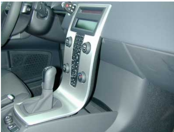
Die Bedienung des S40 ist weitgehend funktionell und einfach. Optisches Highlight im sonst eher sachlich geratenen Innenraum ist die frei stehende Mittelkonsole. Praktische Vorteile bringt sie indes nicht.