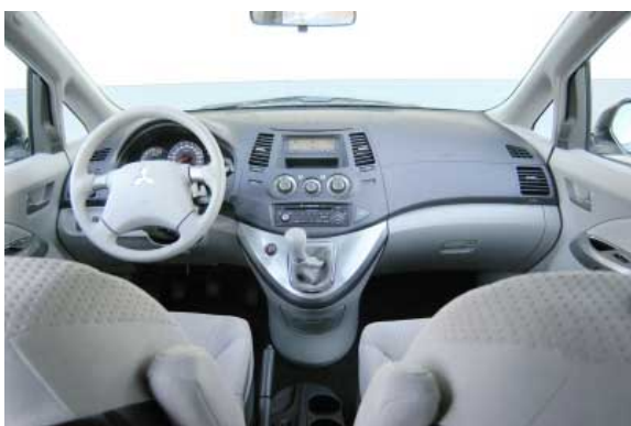
Bis auf wenige Ausnahmen ist die Bedienung des Grandis einfach und funktionell, das Design entspricht europäischen Standards.

Für die zweite Reihe werden zwei Einzelsitze oder eine durchgehende Dreier-Sitzbank angeboten. Bei zurückgestellten Vordersitzen reicht die Kniefreiheit bei der zweiten Variante für ca. 1,80 m große Mitfahrer aus. Man sitzt angenehm hoch und auch hier ist der Abstand zum Dach groß, jedoch sind die Sitze nahe an der Tür, was beengt. Auf den zwei hintersten Sitze reicht der Platz für bis 1,75 m große Insassen.