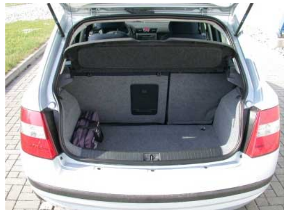
Mit nur 295 l Kofferraumvolumen rangiert der Stilo in der unteren Mittelklasse auf einem der hinteren Plätze. Hier bietet die Konkurrenz zum Teil erheblich mehr.