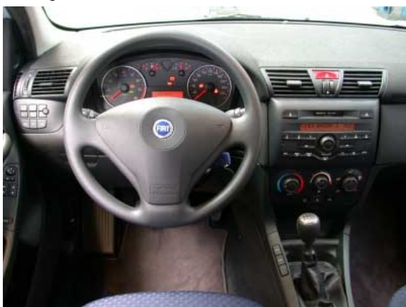
Bis auf wenige Detaillösungen ist der Stilo einfach und funktionell zu bedienen.