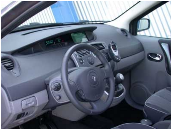
Das Armaturenbrett des Scenic zeigt das markentypische Design. Leider sind die zentral angeordneten Instrumente nicht immer einwandfrei ablesbar.