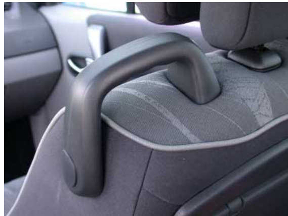
Die vorderen Sitze haben auf der Innenseite Haltegriffe.