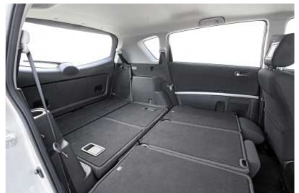
Mit wenigen Handgriffen lässt sich der Kofferraum auf bis zu 715 l Volumen erweitern.