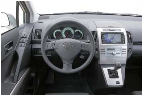
Einfache Bedienung und hochwertige Verarbeitungsqualität kennzeichnen den Fahrerplatz.