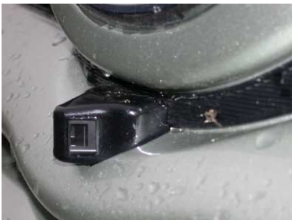
Eine im Bug eingebaute Kamera ermöglicht die Beobachtung des vorausliegenden seitlichen Verkehrsraums auf einem Monitor und damit ein gefahrloseres Einfahren in einen Kreuzungsbereich

Verkehrsraum links und rechts vor dem Fahrzeug per Monitor überwacht werden kann. Zum leichteren rückwärts Einparken sind wahlweise eine Heckkamera (die schlecht funktioniert) oder akustische Einparksensoren erhältlich, die gut funktionieren.