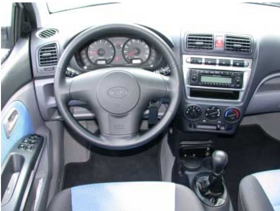
Hier gibt es nur wenig zu bemängeln, das Design entspricht europäischen Standards.