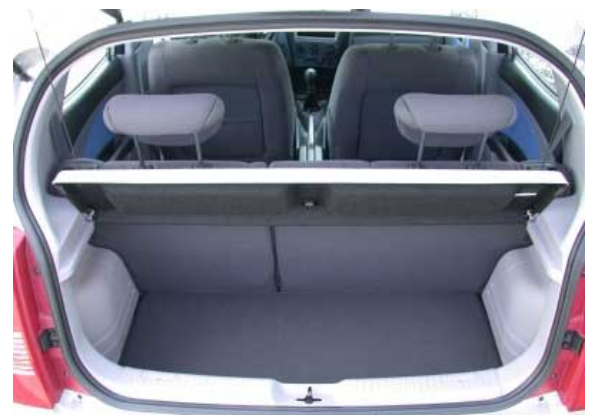
Mit nur 105 l Kofferraumvolumen ist der Picanto das Schlusslicht in der Kleinwagenklasse.

selbst für diese Klasse sehr klein, lässt sich aber durch Umklappen der Rückbank auf stattliche 450 l erweitern (gemessen bis zur Fensterunterkante).