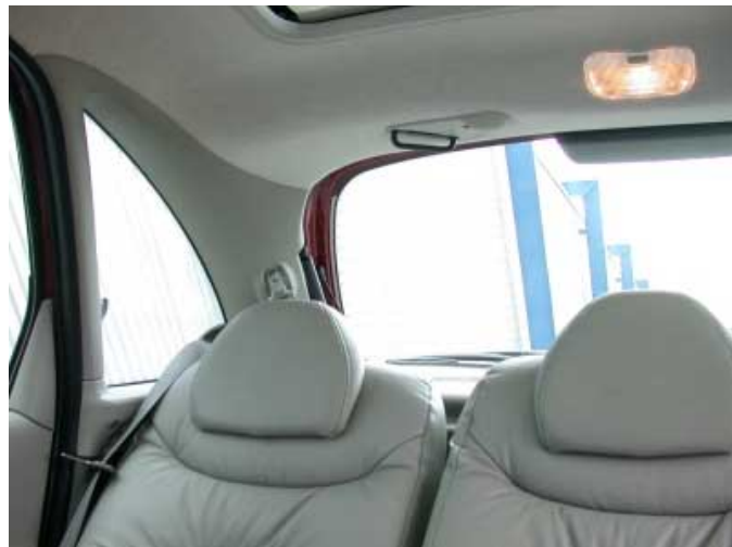
Die Übersichtlichkeit ist erstaunlich gut.