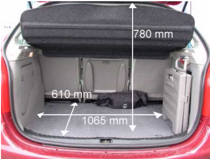
Mit 470 l Volumen kann der Kofferraum des Xsara Picasso überzeu- gen. Rechts sieht man den zusammenklappbaren Einkaufs- wagen.

auch herausgenommen und als Einkaufswagen verwendet werden kann.