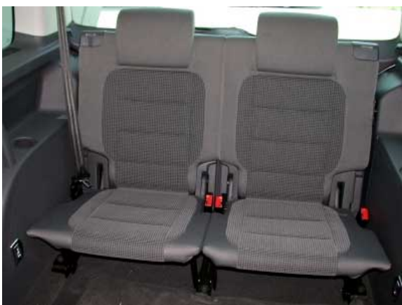
Gegen Aufpreis lassen sich zwei zusätzliche Sitze für die dritte Reihe ordern.