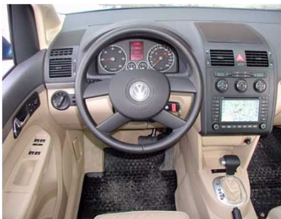
Der Touran präsentiert sich im von VW gewohnten nüchternen Innenraumdesign. Der guten Bedienbarkeit tut dies keinen Abbruch, Ergonomie und Funktionalität sind gegenüber den bisherigen VW-Fahrzeugen der unteren Mittelklasse verbessert.