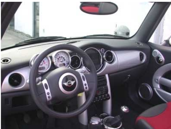
Auch wenn nicht alle Armaturen und Schalter gut ablesbar oder erreichbar sind, verströmt der Mini Liebe zum Detail und grenzt sich damit wohltuend zum nüchtern funktionellen Design vieler Mitbewerber ab.