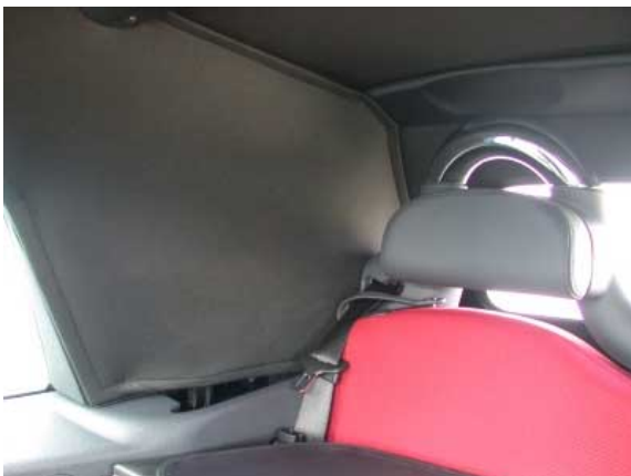
Bei geschlossenem Verdeck ist die Sicht, besonders nach schräg hinten, sehr schlecht.