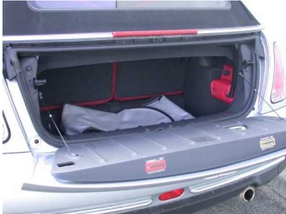
Nur 130 l Volumen bietet der Kofferraum des Mini Cabrio.