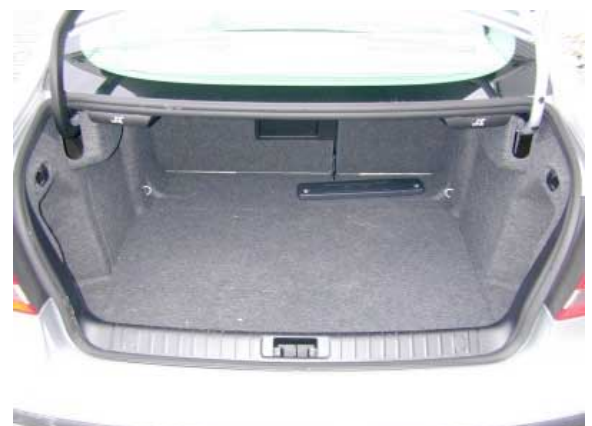
Sehr groß und gut nutzbar geriet das Kofferraumabteil des neuen 9-3.