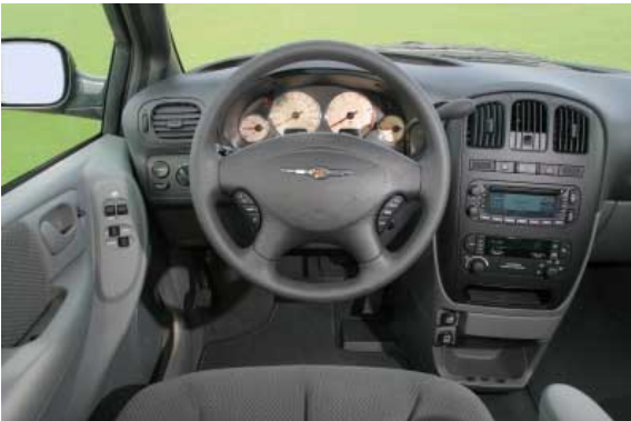
Weitgehend funktionell, jedoch nicht besonders hochwertig verarbeitet präsentiert sich der Innenraum des Voyager.

sich nicht öffnen. Zum Anlegen der Gurte auf den hinteren Sitzen sind zwei Hände erforderlich, weil die Schösser nicht fixiert sind.