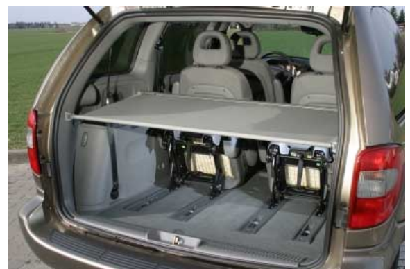
Mit 1040 l Volumen ist der Kofferraum einer der Größten seiner Klasse.