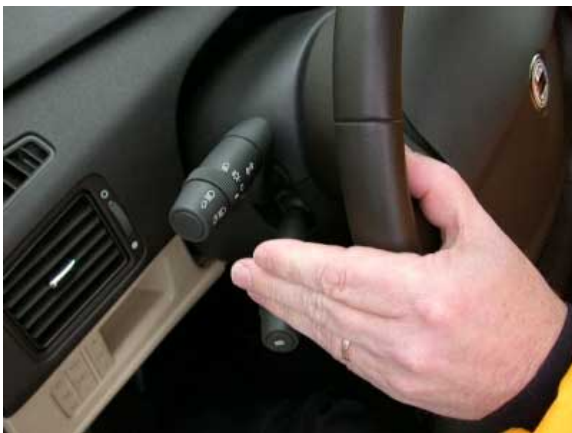
Trotz generell guter Bedienbarkeit hakt es beim Musa im Detail. So sind die Bedienelemente zu weit vom Lenkrad entfernt.