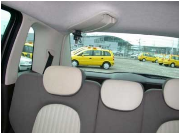
Während bei vielen neuen Fahrzeugen die Übersichtlichkeit stark eingeschränkt ist, sieht man im Musa gerade auch nach hinten erstaunlich gut.