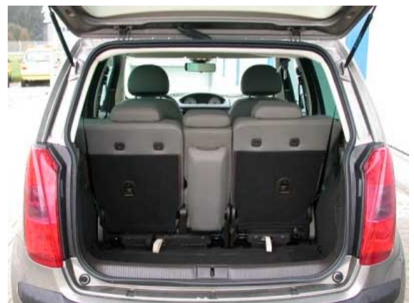
Mit 310 l Volumen ist der Kofferraum standesgemäß groß, erreicht jedoch nicht ganz die Konkurrenten, wie den Opel Meriva mit 330 l Volumen