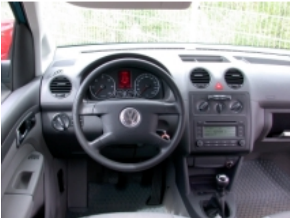
Der Innenraum präsentiert sich im Nutzfahrzeuglook, der Funktionalität tut dies keinen Abbruch.