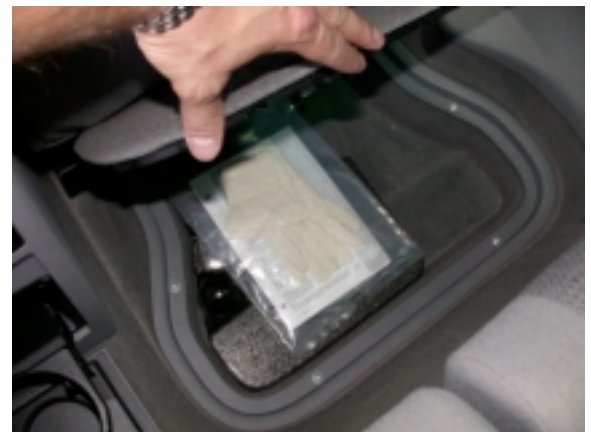
Im Wagenboden verbergen sich kleine Ablagemöglichkeiten.