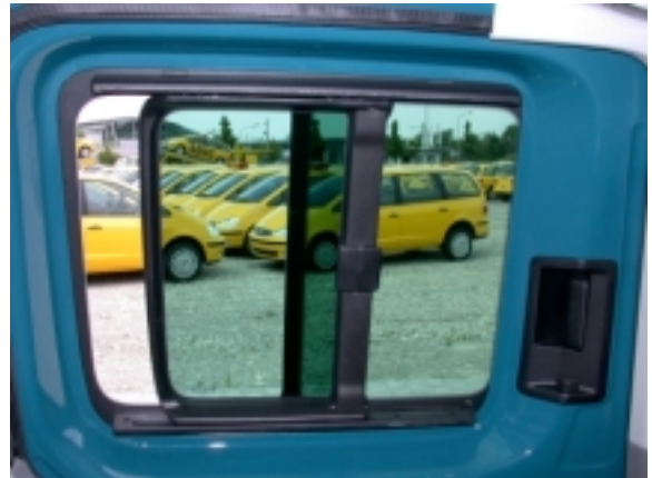
In den beiden Schiebetüren befinden sich statt versenkbarer Scheiben nur schmale Schiebefenster.