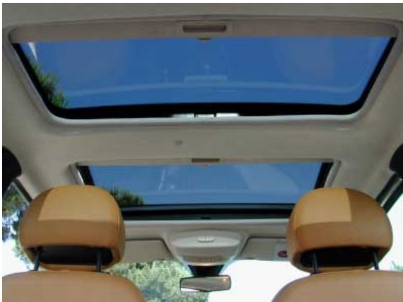
Gegen Aufpreis lassen sich zwei große Glasdächer ordern.

kaum mehr. Gegen Aufpreis ist hinten eine akustische Einparkhilfe erhältlich.