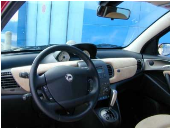
Die stilvolle Innenausstattung verströmt Exklusivität, die Bedienung ist bis auf die mittig platzierten Instrumente funktionell.